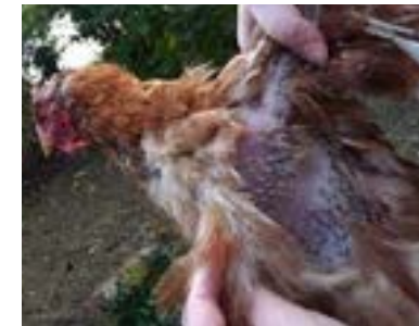
Mue : processus naturel qui dure en moyenne deux mois

Assurez-vous donc que vos poules soient bien nourries à cette période car elles auront besoin de beaucoup d'énergie pour faire repousser leurs plumes.