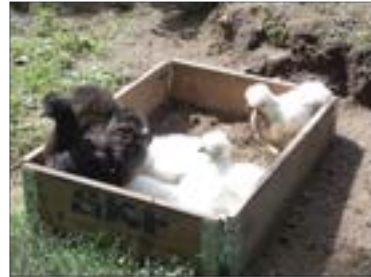
Le parcours des poules

Plus l'espace est grand, mieux c'est. Elles ne passent pas leur journée dans le poulailler ! Elles adorent se promener, gratter la terre et se régaler des herbes, insectes, larves et limaces qu'elles y trouvent.